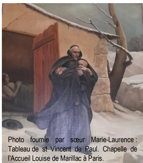
Tableau de st Vincent de Paul. Chapelle de l'Accueil Louise de Marillac à Paris.

Dans son encyclique Dilexit nos , le pape François consacre un court paragraphe à St Vincent de Paul. Il le cite : « Dieu demande principalement le cœur , le cœur, et c'est le principal. D'où vient qu'un qui n'aura pas de bien méritera plus que celui qui aura de grandes possessions auxquelles il renonce ? Parce que celui qui n'a rien y va avec plus d'affection ; et c'est ce que Dieu veut particulièrement... »