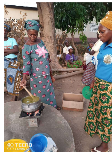
Préparation de la bouillie enrichie