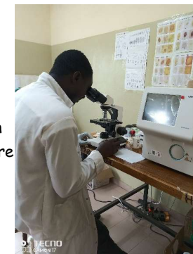
le technicien de laboratoire