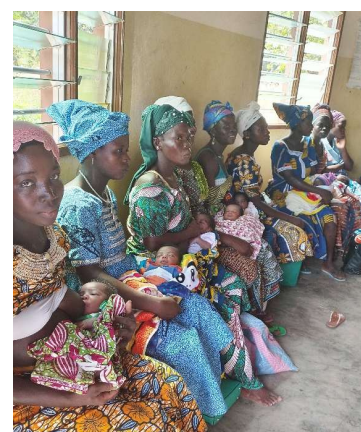
vaccination des bébés au centre