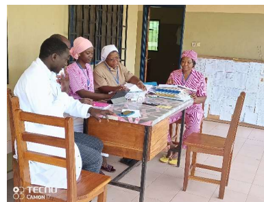
Le staff en réunion