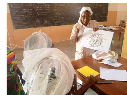
Clôture de 3 jours de formation sur l'alimentation des bébés