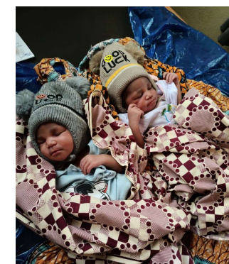
Jumeaux nés au centre