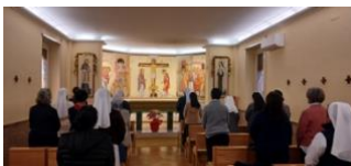
Chapelle de la Communauté