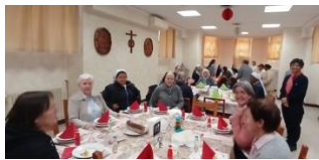
Sœurs capitulaires et communauté

Nous sommes ensuite allées à la chapelle de la communauté et, en communion avec la Famille Marianiste du monde entier, nous avons prié la prière de trois heures.