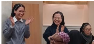
Sœurs de la communauté