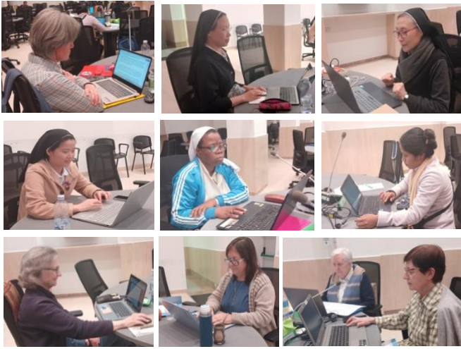
Membres du chapitre lisant le texte des Constitutions

Dans notre processus de travail, après que l'assemblée ait voté tous les articles amendés, une journée entière a été consacrée à la lecture de l'ensemble du texte dans une atmosphère de prière afin d'apporter les dernières corrections.