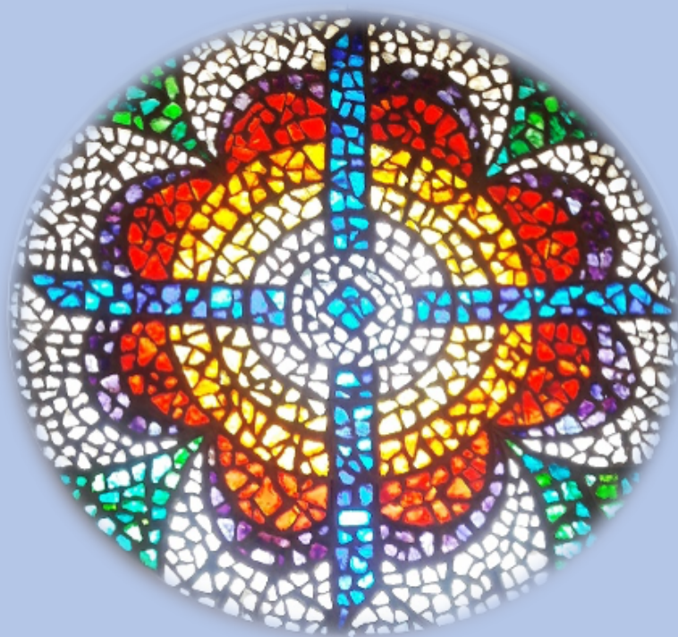
Rosace : église mausolée de Moïse – Mont Nébo Jordanie

« Un temps pour changer » Viens, parlons, osons rêver.... Pape François