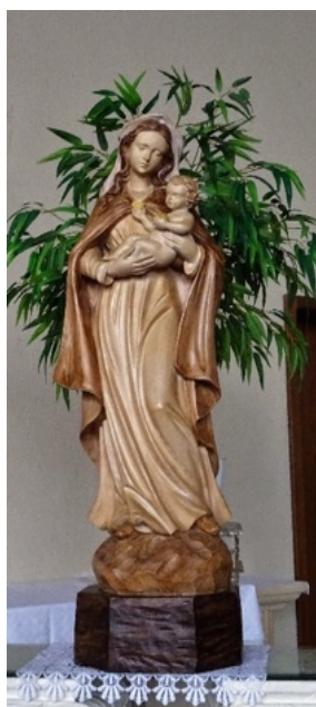
Photos : Vitrail de l'Assomption et Vierge à l'Enfant - Eglise Ste Thérèse de Farébersviller