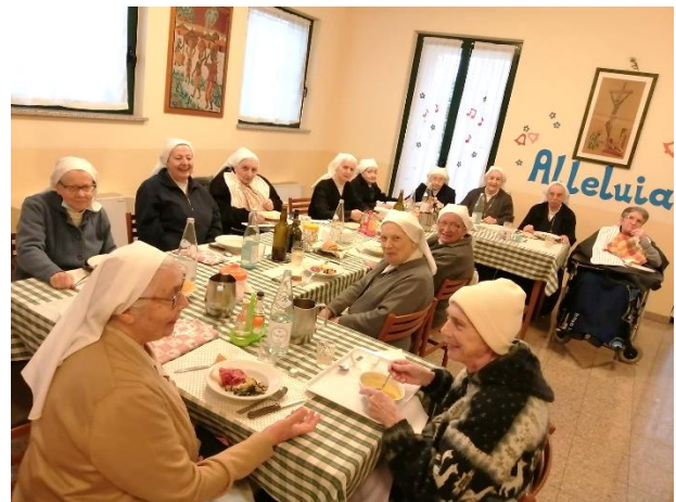
Déjeuner du 2ème dimanche de Pâques avec l'ensemble de la communauté.