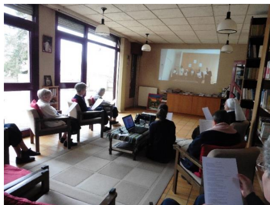
La communauté de Béthanie (Susy-en-Brie) et la communauté d'Agen connectées pour célébrer le passage en Région.

Nous espérons pouvoir à nouveau prendre des photos où nous ne regardons pas l'écran de l'ordinateur. Nous remercions chaque conseil d'unité pour l'aide qu'il nous a apportée pour la communication avec chacune des communautés.