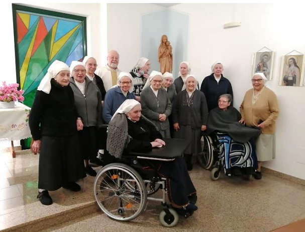
La communauté de Pallanza à la fin de la retraite.

Les blessures et les cicatrices que chacun a sont certainement évidentes, mais nous les sentons "transfigurées" dans celles que Jésus a et nous montre dans son Corps ressuscité.