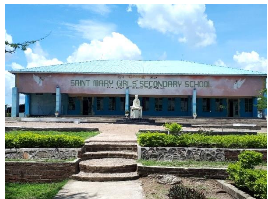
Notre Dame de la Sagesse préside l'établissement