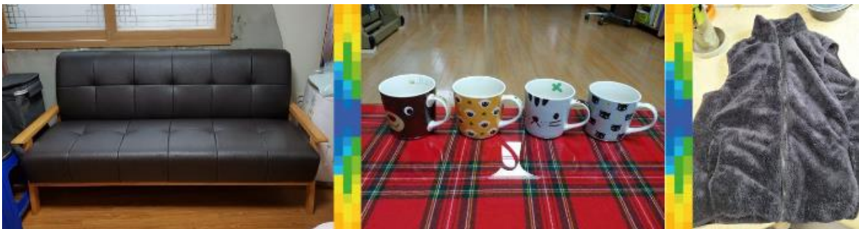
Objets que nous pouvons trouver dans le Marketplace