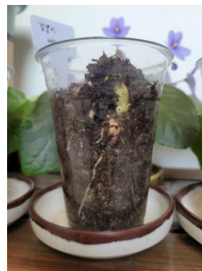
Chaque sœur a reçu des graines de haricot et est responsable du soin de sa plante, partageant sa réflexion personnelle sur le soin de la création.