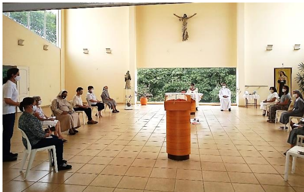
Eucharistie en la fête de Mère Adèle