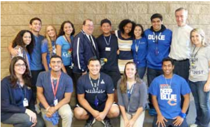
Lycée Chaminade (Los Angeles) Elèves animateurs