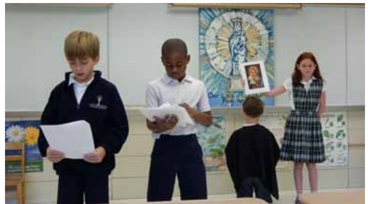
Saint Louis (Missouri) Enfants jouant la vie du P. Chaminade

A l'université de Dayton, l'IMRI, Institut d'études mariales est le seul que nous possédions dans le monde, avec la plus grande bibliothèque mariale existante. Il mérite une présentation complète.