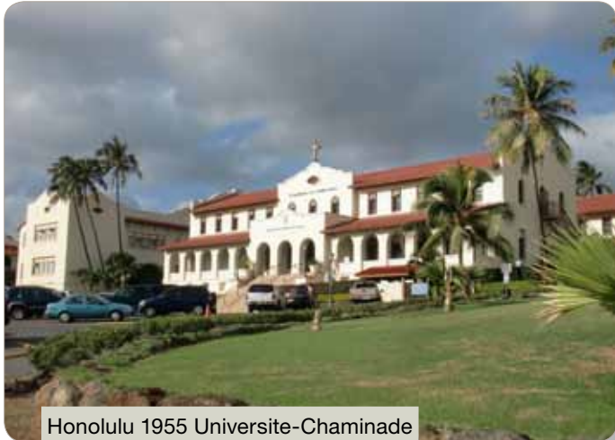
Honolulu 1955 Université-Chaminade