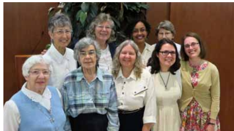
Les deux communautés de Dayton, à droite les deux postulantes