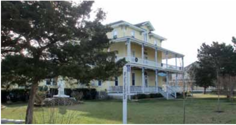
Cape May (New Jersey) Centre de retraites familiales