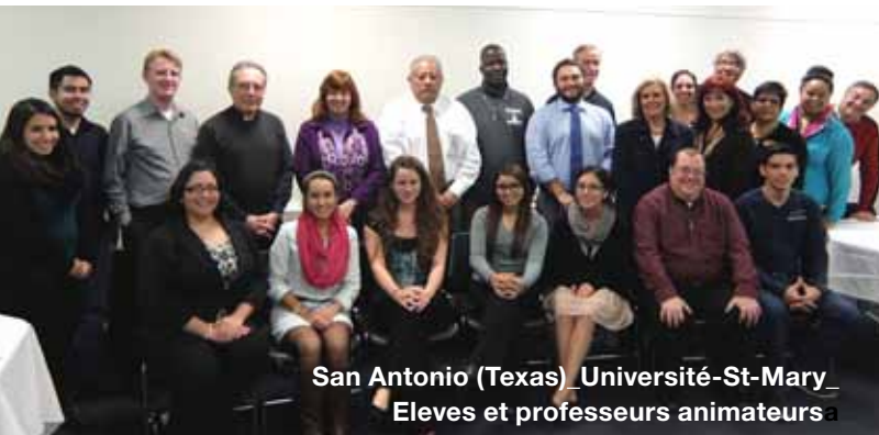
San Antonio (Texas) Université-St-Mary Elevés et professeurs animateurs

Voyager aux Etats-Unis fait comprendre l'immensité et la diversité de ce pays et de la Province qui en porte le nom. Quelques statistiques nous le disent : 320 frères en 40 communautés, surtout aux Etats-Unis, mais aussi au Mexique et en Irlande, et une unité dépendante en Inde avec 92 membres ; trois universités, 17 établissements scolaires, 7 paroisses, 4 centres de retraite et de nombreux services assurés par des frères. Mentionnons aussi la grande diversité culturelle : l'influence hispanique au Sud, presque bilingue, l'immigration qui se poursuit depuis l'Asie de l'Est - la Chine surtout ; la forte composante afro-américaine dans l'ensemble du pays.