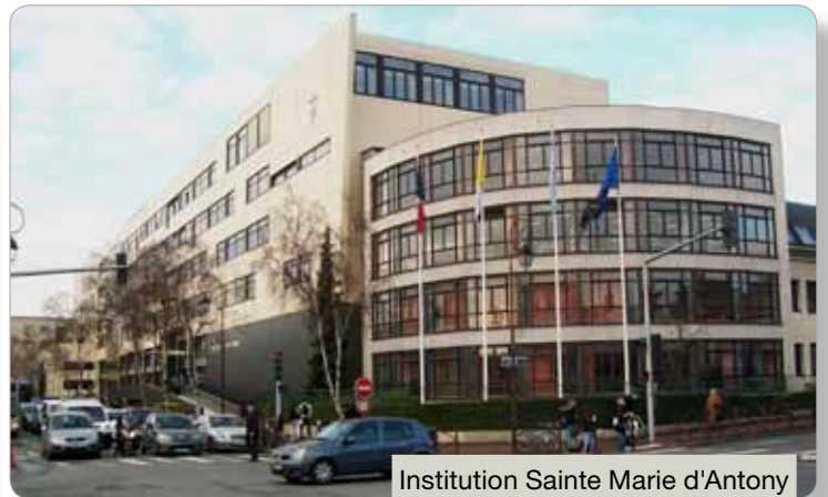
Institution Sainte Marie d'Antony