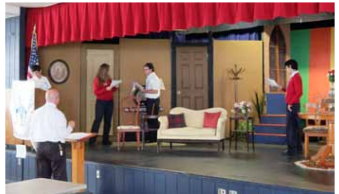
Lycée Chaminade Madonna Hollywood (Floride) Cours de Théâtre